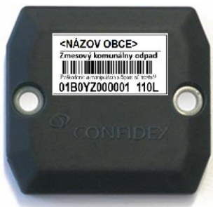
Vyrobený čip má rozmery 51 mm x 46 mm x 10 mm

Čipy na kovové nádoby sú umiestnené v plastovom obale, ktoré je potrebné ku nádobe prichytiť nerezovými nitmi. Každý čip má nálepku s potlačou, na ktorej je uvedený typ odpadu a objem nádoby. .