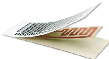
Ukážka zloženia vrstiev čipu určeného na plastovú nádobu.