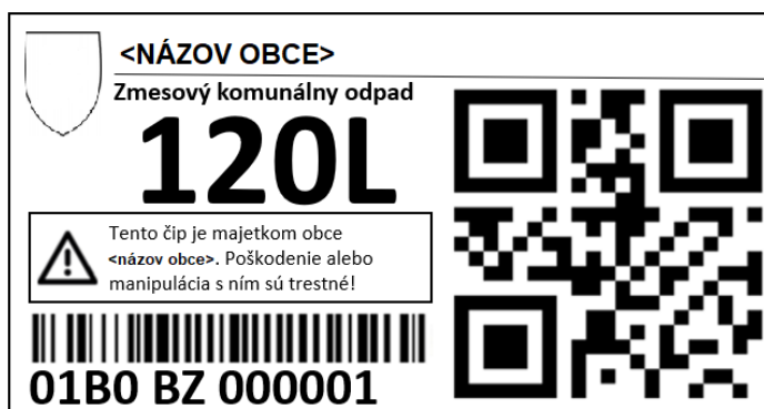
Ukážka potlače na obrázku nižšie je pre 120L nádobu ZKO.