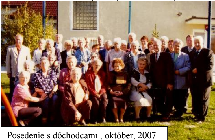
Posedenie s dôchodcami , október, 2007

V mene našom i všetkých obyvateľov vám úprimne ďakujeme za prácu, ktorou ste prispeli pri